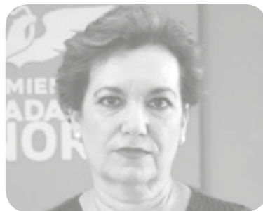
María Dolores del Río