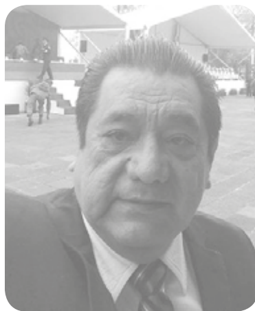
Félix Salgado Macedonio