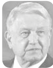
Manuel López Obrador

Cerrarán playas en Empalme y Guaymas en semana santa Definitivamente en los municipios de Guaymas y Empalme no hay marcha atrás, las playas en Semana Santa,