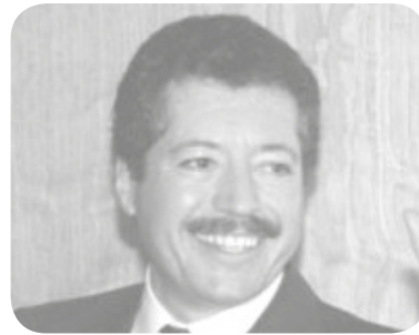
Luis Donald Colosio